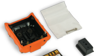
VTSB-211 Kit batterie lithium longue durée