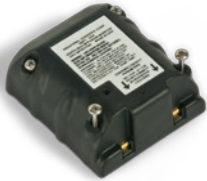
17151184-01 Couvercle de batterie lithium-ion longue Durée