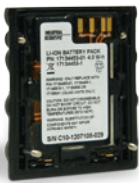
VTSB-101 Kit batterie lithium-ion