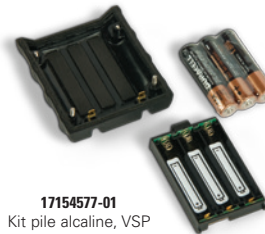
17154577-01 Kit pile alcaline, VSP