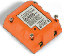
17151184-11 Couvercle de batterie lithium-ion longue Durée