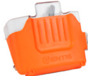
17157329-1 Porte de remplacement