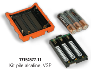
17154577-11 Kit pile alcaline, VSP