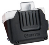
17157329-0 Porte de remplacement