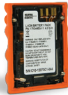
VTSB-111 Kit batterie lithium-ion